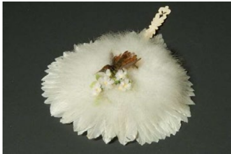
Abb. 3: Kolibrifächer der Kaiserin Elisabeth

Kaiserin Sisi hatte immer einen Fächer dabei. Mit dem praktischen Gegenstand konnte sie sich bei großer Hitze Luft zufächeln oder ihr Gesicht dahinter verstecken. Sisis Fächer waren sehr schön gestaltet.