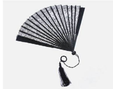
Abb. 4: Schwarzer Spitzenfächer aus dem Besitz der Kaiserin Elisabeth