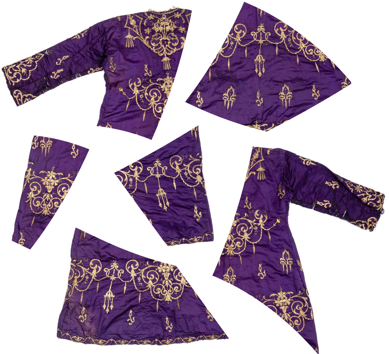
Abb. 5: Osmanisches Festgewand, Marokkanisches Mantelkleid der Kaiserin Elisabeth, veilchenblaue Seide mit Goldrelief-Stickereien

Sisi liebte schöne Kleider. Von einer ihrer Reisen brachte sie ein wertvolles Gewand mit. Leider wurde es versehentlich zerschnitten. Kannst du es wieder zusammensetzen?