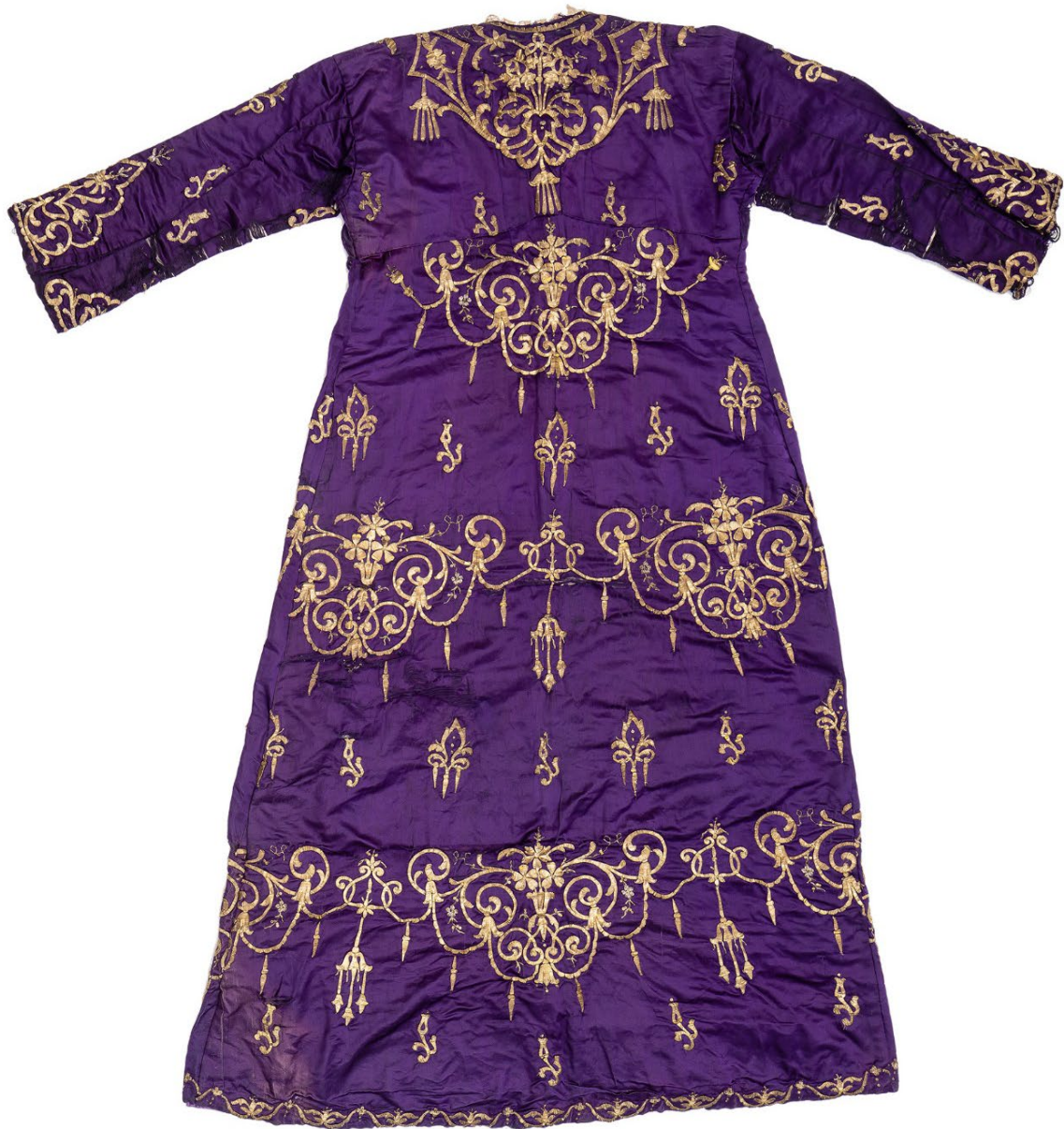
Abb. 5: Osmanisches Festgewand, Marokkanisches Mantelkleid der Kaiserin Elisabeth, veilchenblaue Seide mit Goldrelief-Stickereien